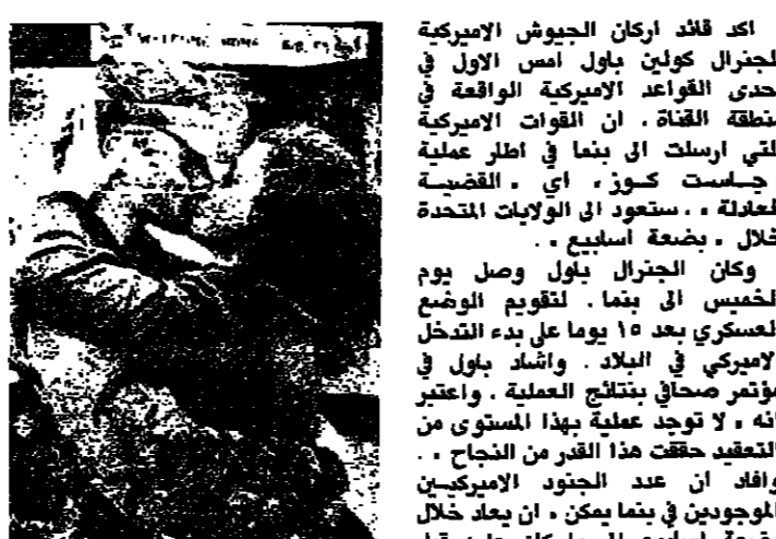
امرأة اميركية تحلق زوجها العائد من بئما الى كليورنيا (البيقية على الصفحة 9)